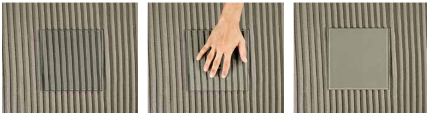
Pruebas de impregnación con H40 Gel gris. Con un simple presionado, es posible obtener un lecho macizo bajo la baldosa.